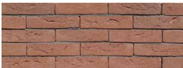
Nijl Rood HV