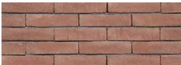
Nijl Rood VB