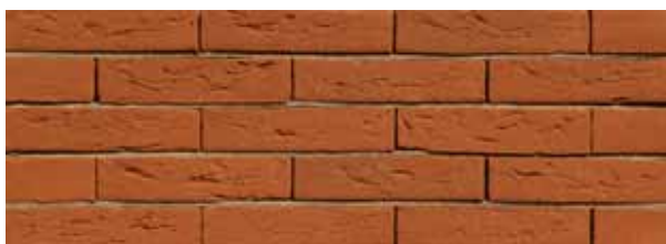
Zambezi Oranje HV