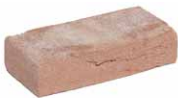
Nijl Rood HV