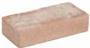
Nijl Rood VB