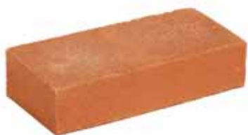
Zambezi Oranje VB