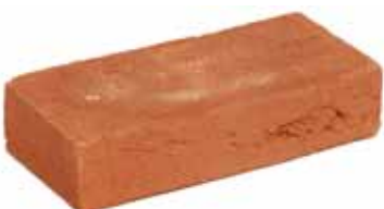
Zambezi Oranje HV