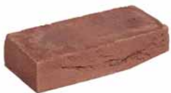
Mississippi Donkerrood HV