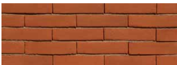
Zambezi Oranje VB