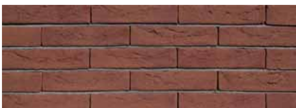
Mississippi Donkerrood HV