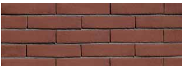
Mississippi Donkerrood VB