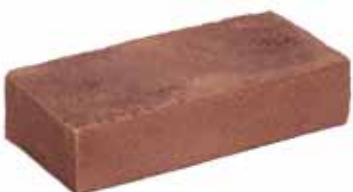
Mississippi Donkerrood VB